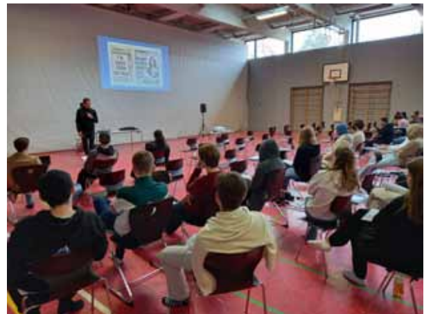
Schule ohne Rassismus

Weitere Projekte, die der Förderverein unterstützt, sind zum Beispiel Vorträge über Drogen- und Mediensucht, welche sich an Schüler*innen und Eltern der Klassen 5 bis 7 richten. Auch das Thema Prävention in Bezug auf das gute Miteinander ist ein wiederkehrender Aspekt, der jährlich zur Verfügung gestellt werden muss. Tanzkurse und natürlich der Abschlussball selbst bilden das alljährliche Highlight für unsere Absolvent*innen.