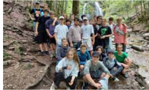
Tage der Orientierung am Spitzingsee