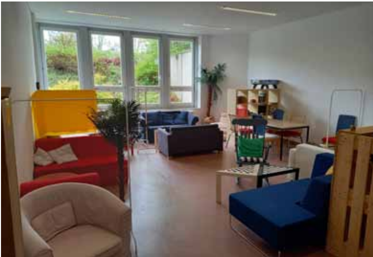
Neugestaltung des Schülercafés 2021/22

Wir fördern jede Fachschaft und Ausbildungsrichtung. Dadurch wollen wir unseren Schüler*innen besondere Erlebnisse und Erfahrungen mittels Durchführung kultureller, sportlicher, musischer und technischer Projekte sowie Aktivitäten vermitteln. Der Förderverein unterstützt diese finanziell, damit die Schule sie bei knappen Geldmitteln realisieren kann.