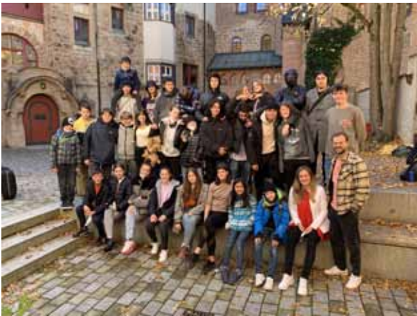
SMV-Seminar Burg Schwaneck

Damit alle Jugendlichen die gleichen Chancen und Möglichkeiten haben, stellt der Förderverein auch hier Mittel zur Verfügung, um rasch auf die Erfordernisse und Notwendigkeiten reagieren zu können.