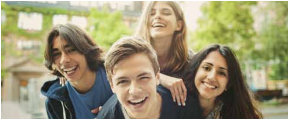
Die Schulfamilie der Realschule Neubiberg

Unsere und Ihre Kinder werden es Ihnen danken!